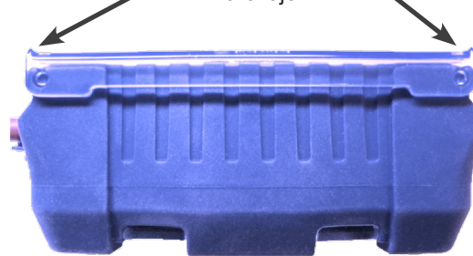
Funda de silicona duradera - vista lateral

Las superficies curvas evitan el drenaje