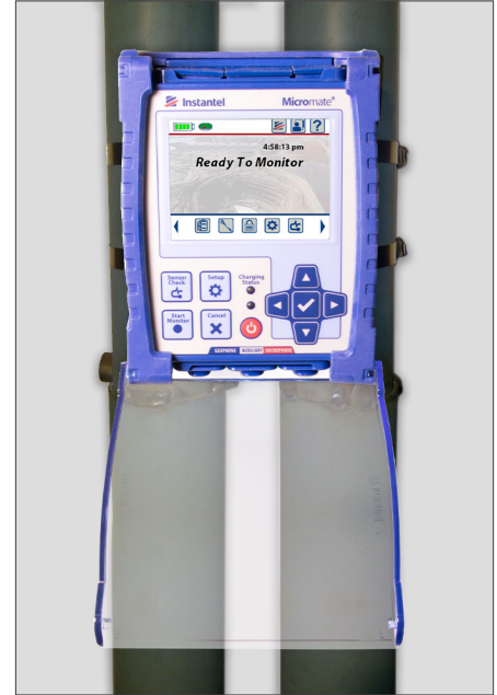
Acceder al Micromate instalado