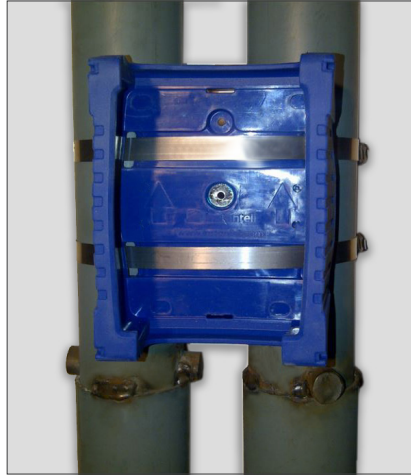
Protectora del Micromate fijado con estribos metá