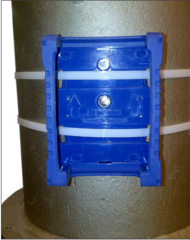
Protectora del Micromate fijado con bridas para cable

Cuando no sea posible o adecuado utilizar tornillos para fijar el unidad Micromate, se puede fijar el protectora con grandes bridas para plásticos o estribos metálicos. Las ranuras en el fondo del protectora proporcionan espacio para estos estribos sin interferir con la instalación de la unidad.