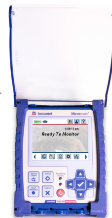
Portátil - se abre la tapa