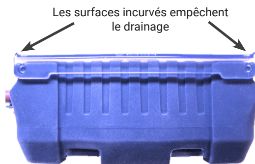
Vue latérale de l'étui en silicone durable

Les surfaces incurvées empêchent le drainage