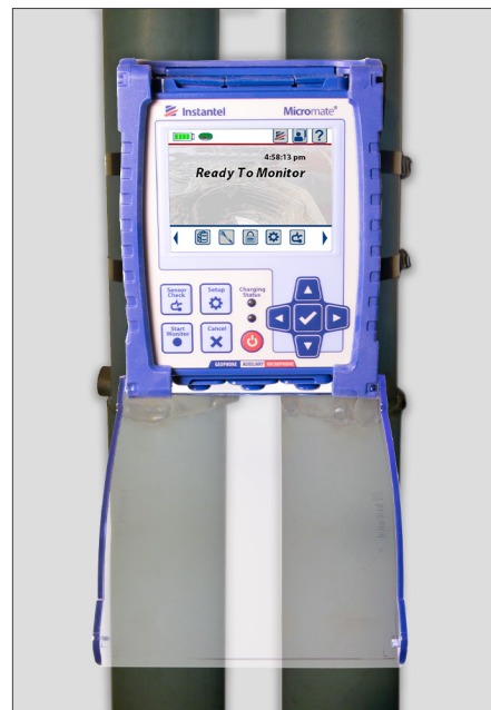
Accès au l'unité du Micromate installé