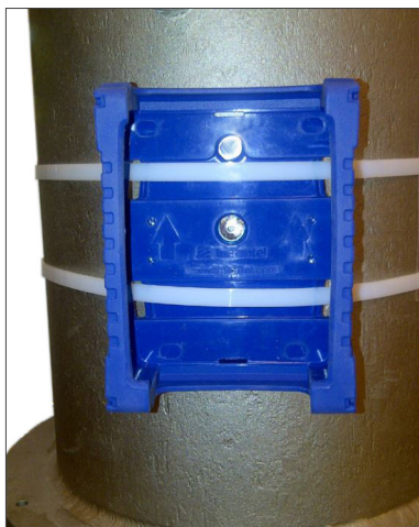
Protection de l'unité du Micromate fixée avec des attaches à tête d'équerre

Lorsqu'il est impossible d'utiliser des vis pour fixer l'unité du Micromate ou que cela n'est pas pratique, la protection peut être placée avec de grandes attaches en plastique ou métalliques. Les fentes dans la partie inférieure de la protection offrent un espace pour ces attaches tout en n'interférant pas avec l'installation de l'unité.