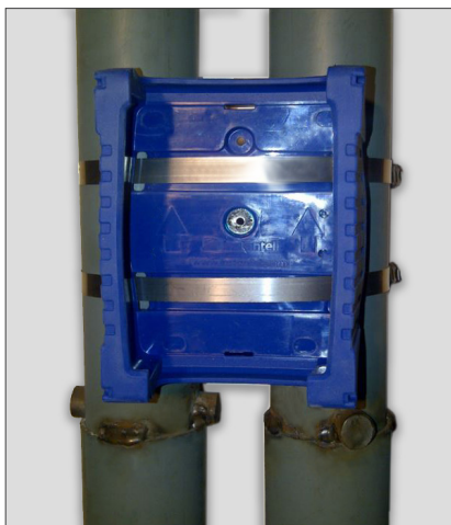
Protection de l'unité du Micromate fixée avec des attaches métalliques